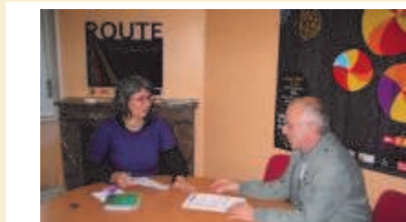
Permanence « accompagnement individuel des associations » à la MDA tous les mercredis ap.-midi.

Vous employez des salariés?... N'oubliez pas!